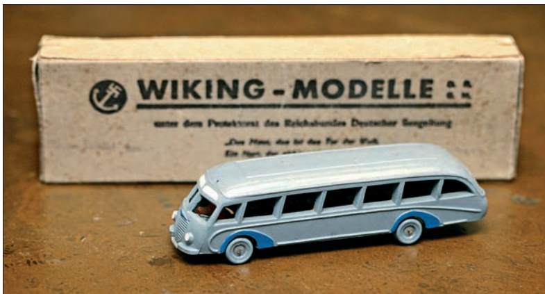
Wer ihn sehen möchte, kann den Stromlinienbus bei Spielwaren Heinsohn auch in die Hand nehmen.