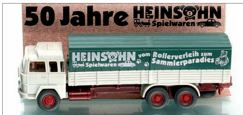
Rätsel gelüftet: Der Magirus Deutz-Dreiachser wurde von Spielwaren Heinsohn für eine kleine Steiff-Sonderedition in Eigenregie bedruckt.