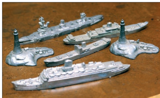
Die Historie von WIKING lebt: Unbemalte Relikte aus der Epoche des Schiffsmodellbaus im Maßstab 1:1250.